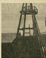
Kopalnia „Nadzieja” w Starej Wsi.

Gorlice, w listopadzie, Zpełnienie niepodziwianie zacięła się nadajeja odkrycia nowych pokładów ropy na zachodnim Podkarpccu. Oto opodal Grybowa, w Starej Wsi, w posesi, nowopodkarpccu na kopalni „Nadziej”, Katedrala Spółkca Naftowa z Gorlic, odkryła w pionierskim szybie „Franciszek” nowozróżła ropy naftowej.